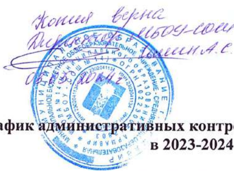
График административных контрольных работ (рубежный контроль) в 2023-2024 учебном году