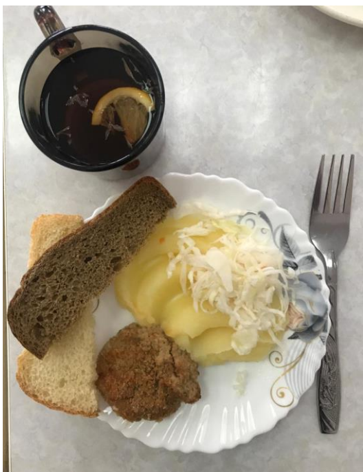
Горячее питание (обед) 1-4 классы и для детей с ОВЗ