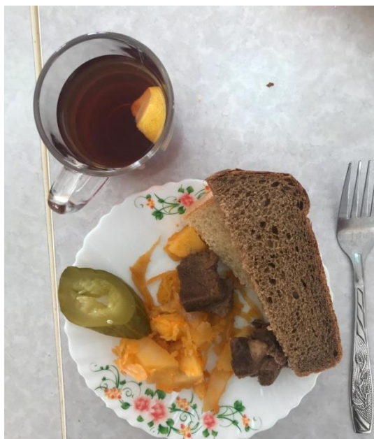
Горячее питание (завтрак) 1-4 классы и для детей с ОВЗ