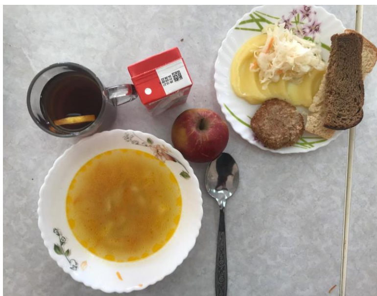
Горячее питание 5-11 классы