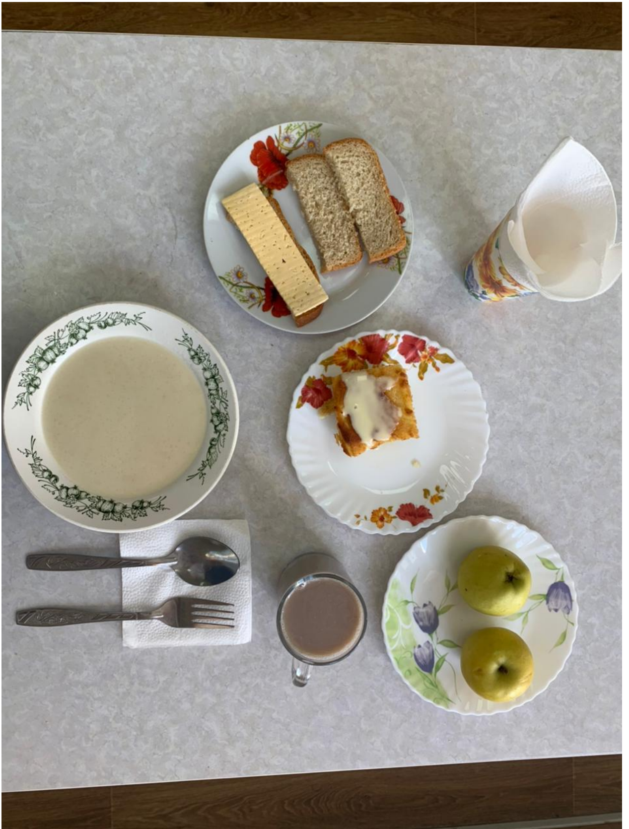
Горячее питание 1 – 4 классы (обед)