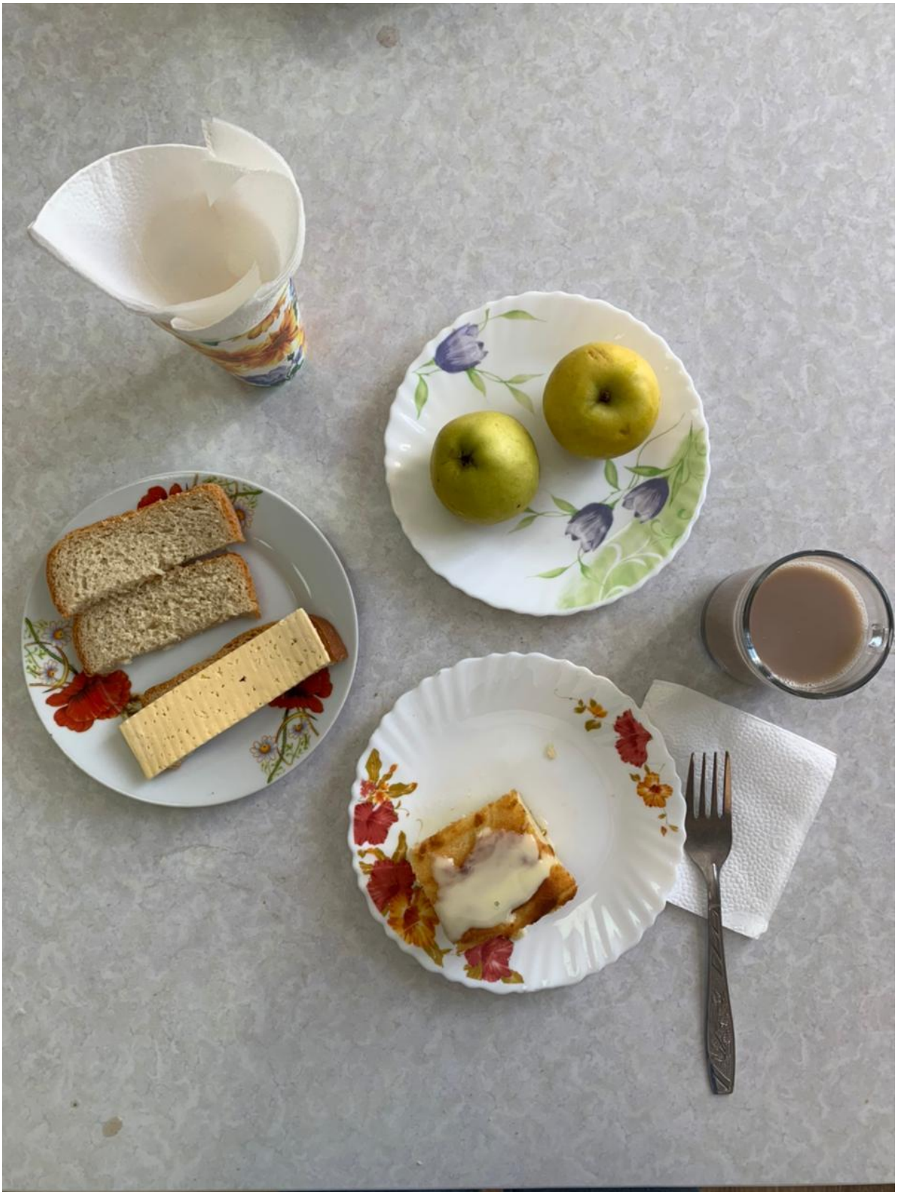
Горячее питание 1 – 4 классы (завтрак)